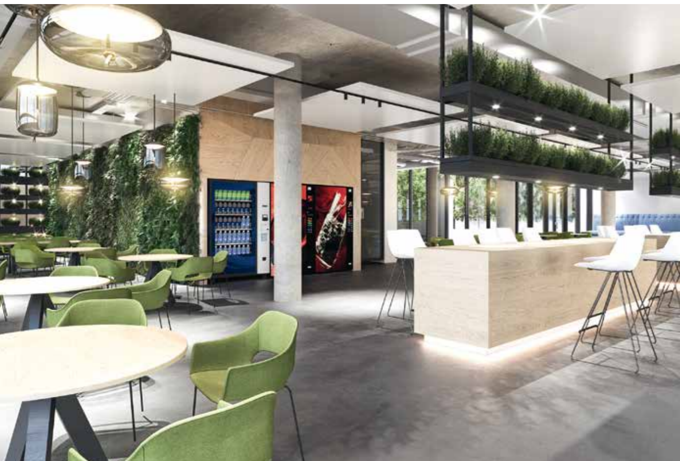
Visualisierungen: Grossmann Visuals